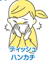
ティッシュ ハンカチ